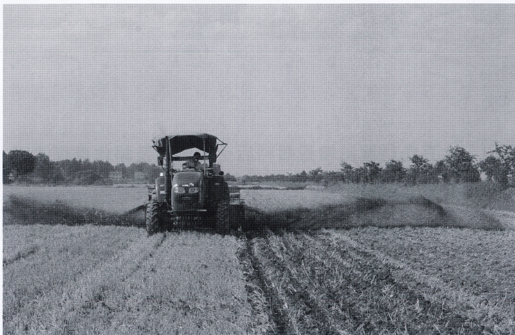
图1 大豆免耕覆秸精量播种