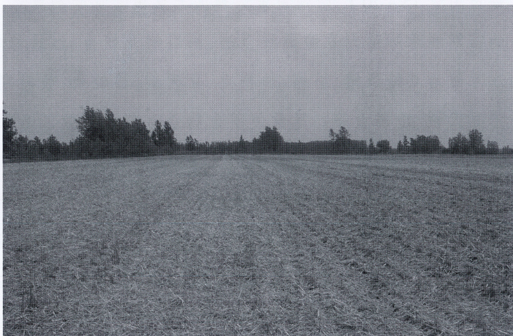
图2 大豆免耕覆秸精量播种后小麦均匀覆盖情况