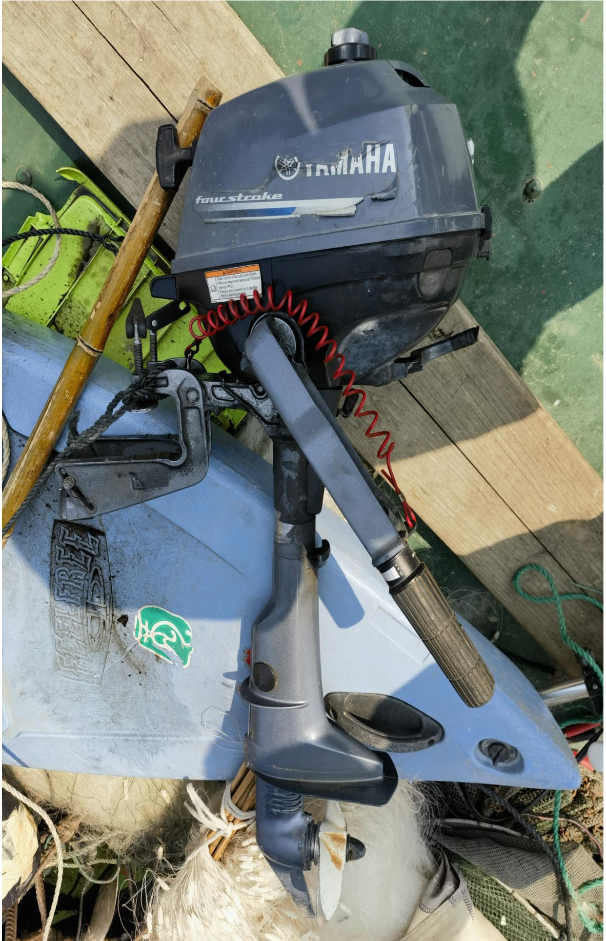
涉案船舶机器照片