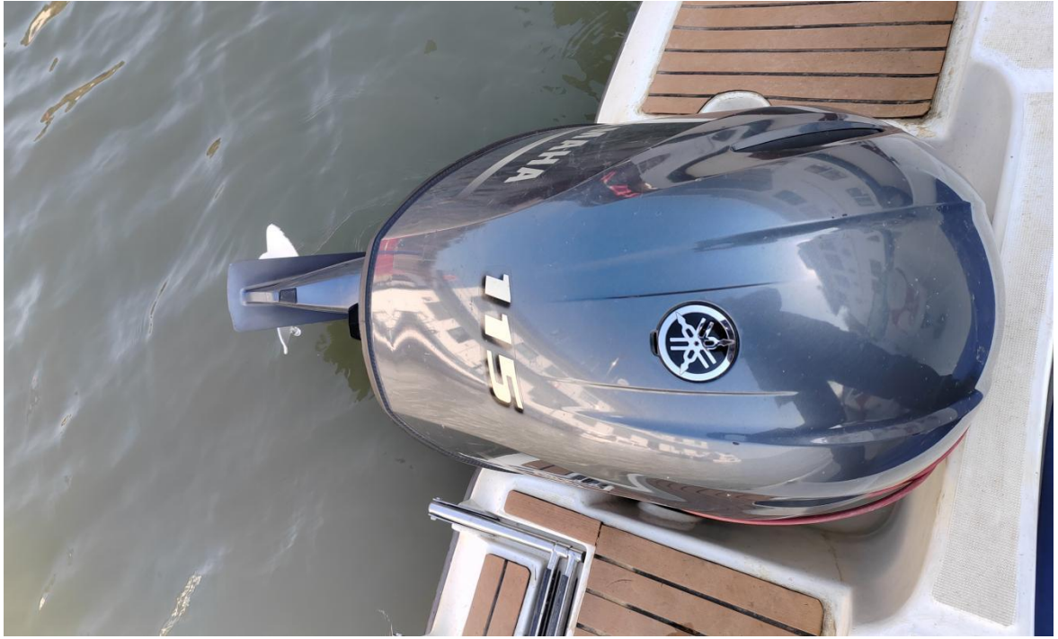
涉案船舶机器照片