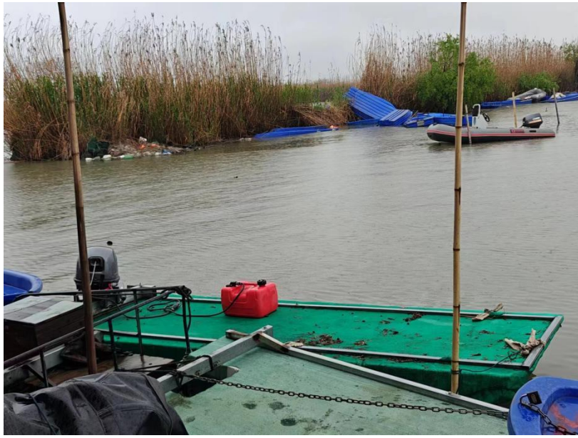
涉案船舶主机照片