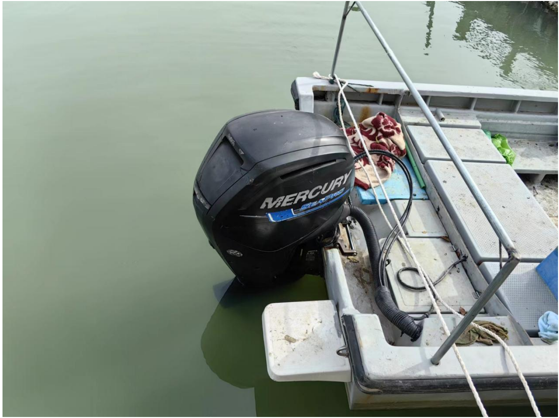
涉案船舶机器照片