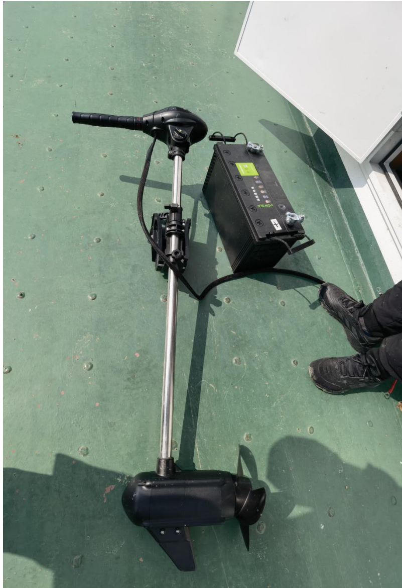
涉案船舶机器照片