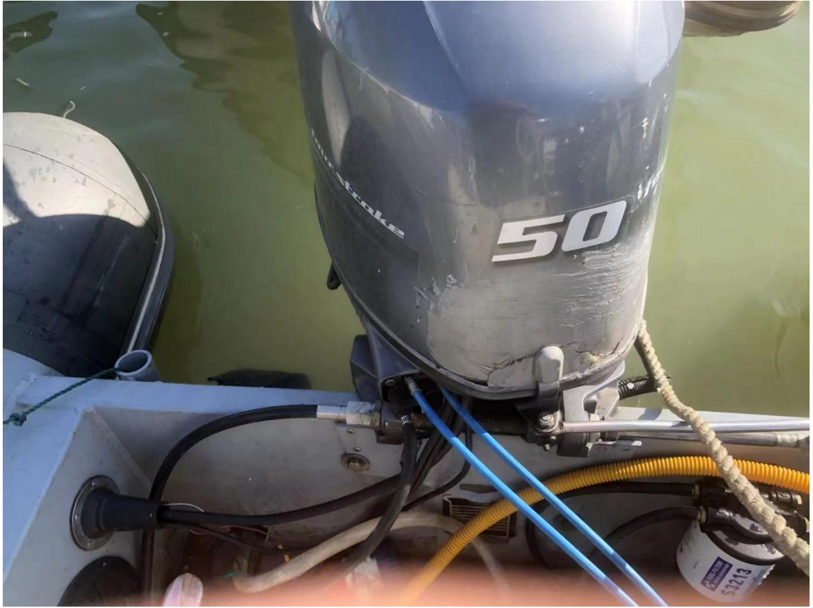
涉案船舶机器照片