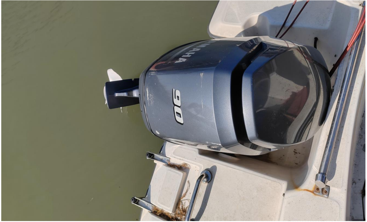
涉案船舶机器照片